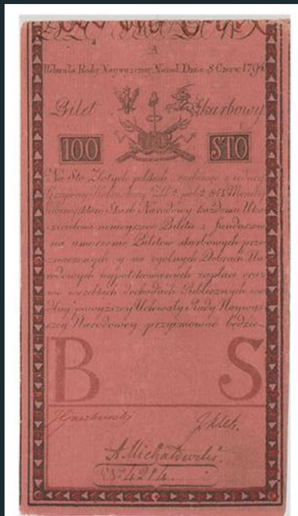
Bilet skarbowy o nominale 100 zł z 1794 r.